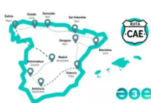
A3E pone en marcha la Ruta CAE 2025