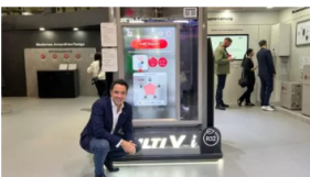
“El sector está muy vivo pese a la caída de las ventas de aerotermia del último año”