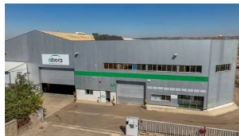
Abora Solar amplía su capital en 2.64 millones y reorganiza su equipo directivo