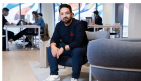
“A través de Nido, las empresas pueden dar fácilmente una propuesta económica al usuario final”