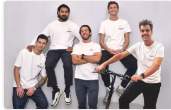
Equipo de Rhyde.