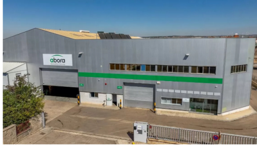
Instalaciones de Abora Solar en Zaragoza.

Inicio / Noticias / Energías Renovables / Ahora firma un acuerdo exclusivo con Yack en el mercado francés