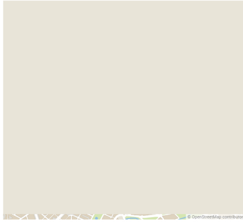
GRÁFICO INTERACTIVO: Seleccione los puntos para obtener más información.

Mapa: HERALDO - Fuente: Ayuntamiento de Zaragoza - Creado con Datawrapper