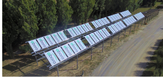
Los paneles solares híbridos que ha desarrollado Abora.

P roducir electricidad, calor y frío con el único 'combustible' que los rayos de Sol. Una utopía que se materializó hace décadas con la llegada de la trigeneración solar. Pero la tecnología es imperfecta. Los paneles híbridos (que combinan la fotovoltaica con los colectores térmicos) solo aprovechan cerca del 20% de la irradiación incidente. El 80% se pierde. La startup española Abora ha dado con la solución: su cubierta transparente genera una especie de efecto invernadero en el panel para aprovechar un 75% de los rayos solares, la misma energía que cinco placas fotovoltaicas.