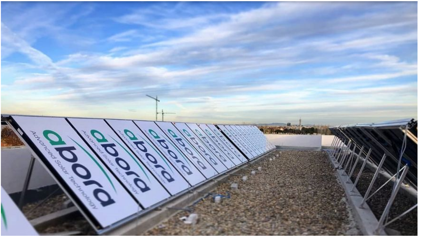
Instalación de paneles solares híbridos de la empresa española Abora Solar.

El secreto es haber creado el panel solar más eficiente del mundo , con un 89% de rendimiento, por encima del fotovoltaico (17%). Es decir, uno solo de sus paneles híbridos genera la misma energía que cinco fotovoltaicos. Por eso los sectores a los que se enfocan son aquellos con altos consumos de agua caliente y electricidad, "como son los hoteles, residencias de ancianos, hospitales, industrias, polideportivos y en el sector agroalimentario", enumera.