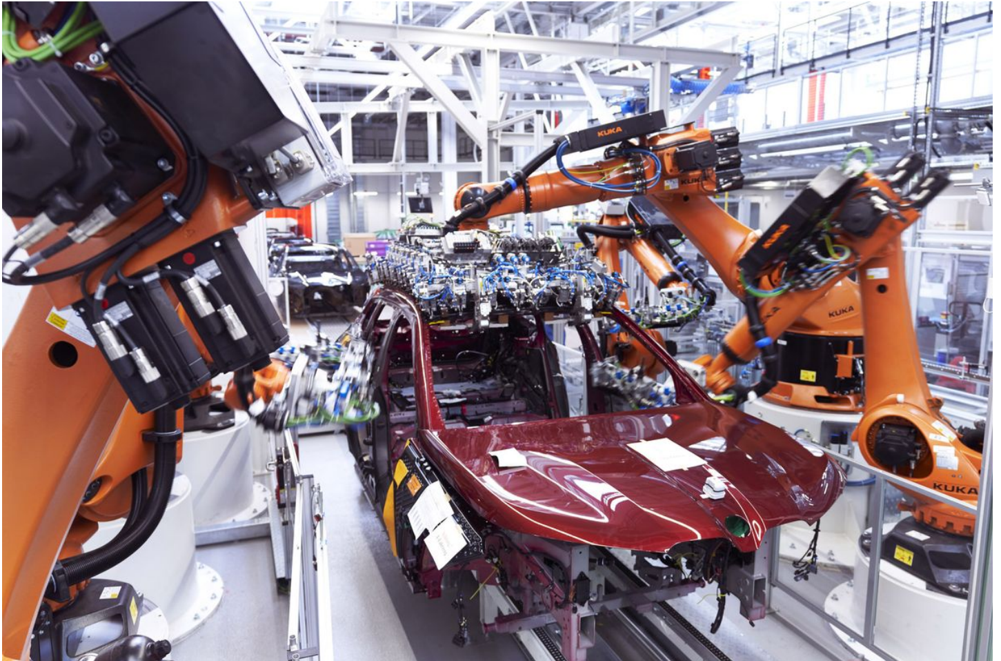
Robots industriales en una fábrica de BMW.

Digitalizar la gestión de aforos en la tienda física y reforzar la seguridad es posible gracias a la solución tecnológica de la startup Beabloo